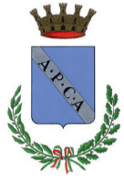
Comune di Amelia