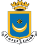
Comune di Lugnano in Teverina