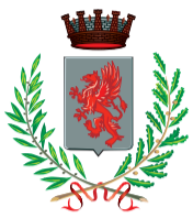
Comune di Narni