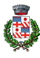
Comune di Alviano